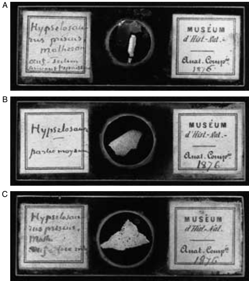
FIG. 1. — Lames minces réalisées à la demande de Paul Gervais dans des fragments de coquille d'œuf d' Hypselosaurus priscus Matheron, 1869 en 1876. Collections du Laboratoire d'Anatomie comparée du Muséum national d'Histoire naturelle, Paris ; A , coupe radiale ; B , coupe tangentielle dans la partie moyenne de l'épaisseur de la coquille ; C , coupe tangentielle dans la face interne de la coquille. Échelle : 1 cm.